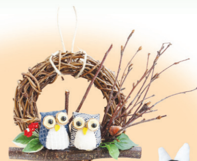
ご利用者皆さんの作品